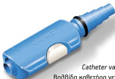
REF 1504 Catheter valve universal Βαλβίδα καθετήρα γενικής χρήσης με πλήκτρο στιγμιαίας κένωσης