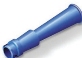
REF 1505 Catheter valve adapter for urine bags flexible, with bayonet lock. Εύκαμπτος προσαρμογέας βαλβίδας καθετήρα γενικής χρήσης